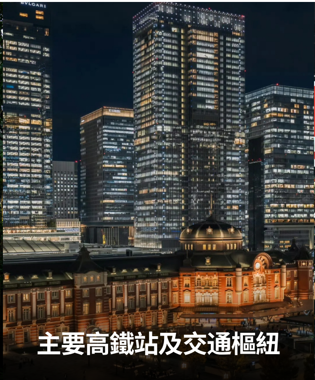
主要高鐵站及交通樞紐