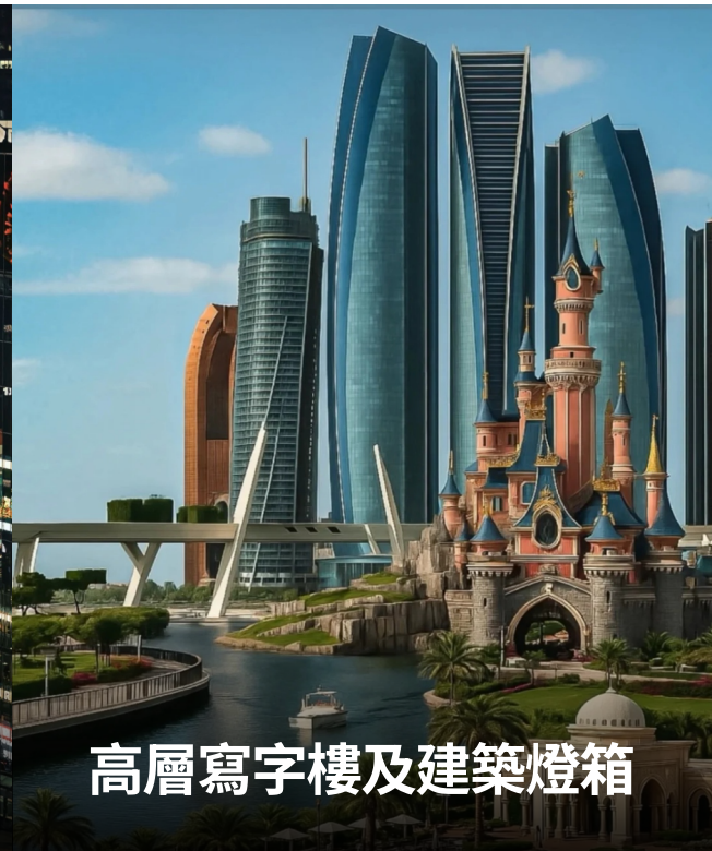
高層寫字樓及建築燈箱