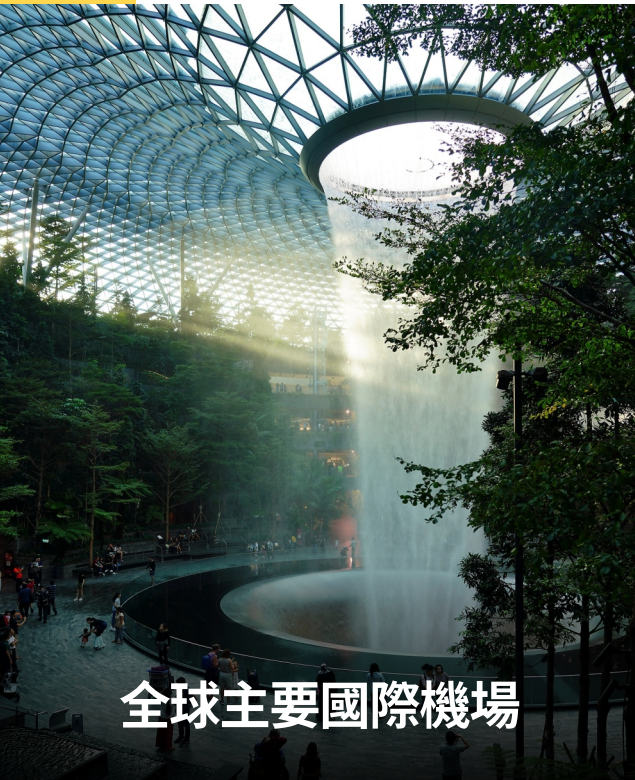
全球主要國際機場

為全面構建“AI資管新標杆”的全球化認知，Tiger AI將啟動總規模達 5000萬美元 的全球廣告推廣專案。該專案將以“科技金融 × 全球智投”為核心定位，通過覆蓋全球主要國際機場、高鐵站、核心商圈及寫字樓樓宇廣告位的立體式傳播網路，精準觸達高淨值旅客、頻繁出行人群與城市菁英圈層。廣告內容將圍繞Tiger AI的智能量化基金、NEURALIGHT 決策引擎、TAC代幣激勵機制等核心亮點，構建多維度品牌場景，強化Tiger Ai“科技驅動收益”的專業形象