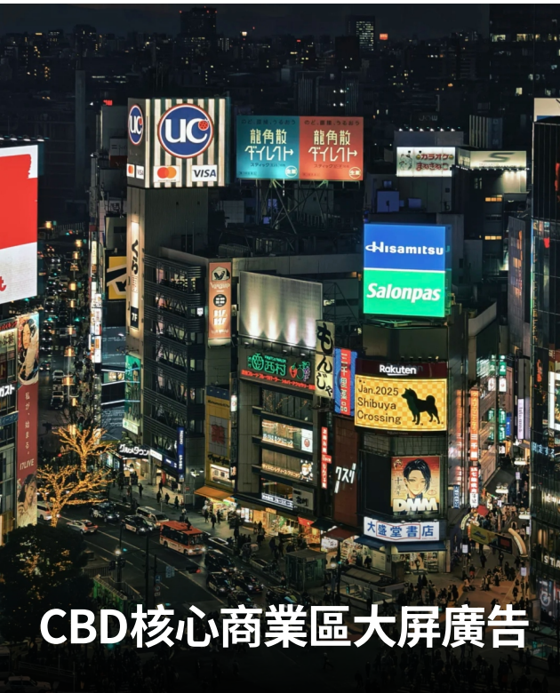
CBD核心商業區大屏廣告